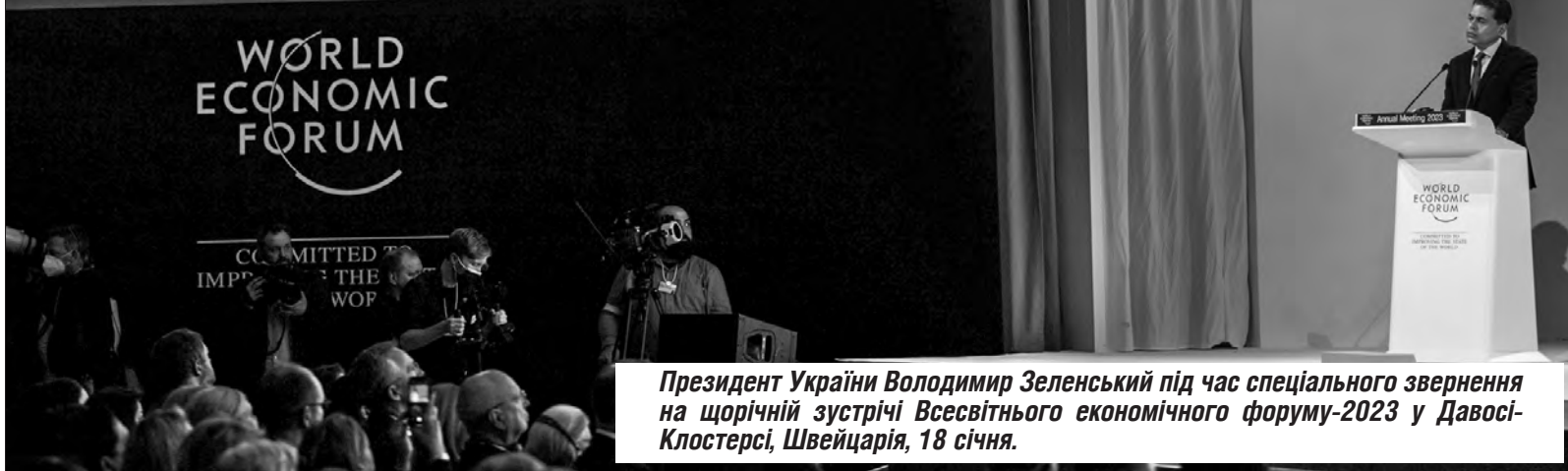
Президент України Володимир Зеленський під час спеціального звернення на щорічній зустрічі Всесвітнього економічного форуму-2023 у Давосі-Клостерсі, Швейцарія, 18 січня.

На цьому Президент Володимир Зеленський наголосив під час онлайн-участі в Українському сніданку в Давосі. Глава держави зазначив, що іноземні країни-партнери не повинні вагатися з наданням військової допомоги Ук-